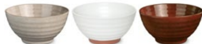
FUJI-BOL RAMEN Grès