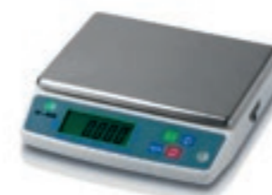
BALANCE ELECTRONIQUE Pieds réglables-Fonctionne à piles-Inox