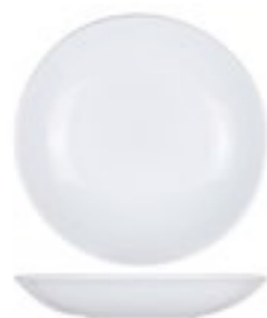
ASSIETTE COUPE CREUSE Porcelaine blanche